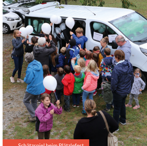
Schätzspiel beim Plätzlefest

Inhaltlich soll im nächsten Jahr (und natürlich darüber hinaus) der Gedanke im Mittelpunkt stehen, dass wir als CVJM für Menschen zum Zuhause werden und nicht