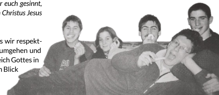
In den 90ern mit dem Bibelkreis für Junge Erwachsene.

Danke für deine offenen Worte. Wir sind dankbar, dass du ein Segen an diesem Ort bist.