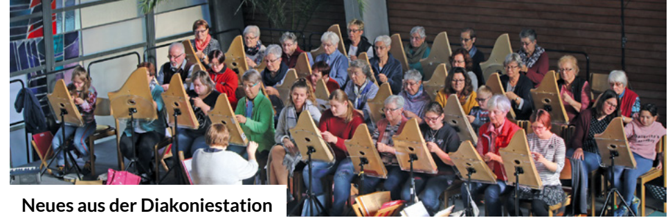
Neues aus der Diakoniestation