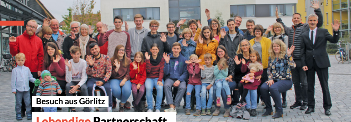
Besuch aus Görlitz